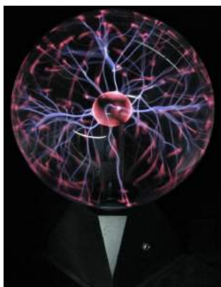
Bol Plasma Schumann 20 cm